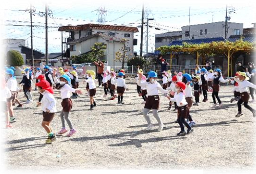
ペアで楽しく踊りました。

あっという間に楽しい時が過ぎ、終了の時間となりました。名残惜しそうに分かれる子ども達を見ながら、この「なかよし」の力が、これからも育っていくことを願いました。