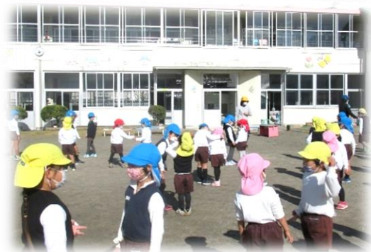
親子遊戯の役割を決め、自己紹介をしました。