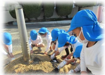
年長さんがもみ殻の中にお芋を入れました。

自然の不思議に心動かされ、その成長を見守り、収穫後は、その恵みに感謝できる子ども達に育つよう願っています。