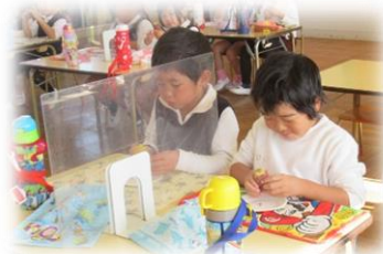
みんなでおいしくいただきました。