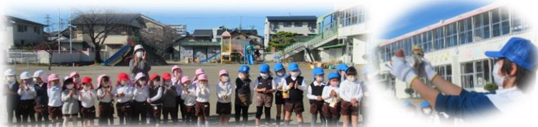
柔らかく焼きあがった焼き芋を見て、歓声が上がりました。