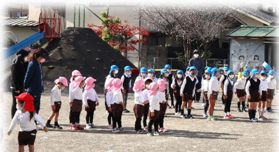
会の始めに、年長さんが、『ひびきあいの日』の「人を大切にする」という目当てを教えてくださいました。

『ひびきあいの日』の取組として園では、「なかよし遊び」をしましたが、遊びを始める前に、年長さんが、『ひびきあいの日』は、「人を大切にする日」であることをみんなに教えてくれました。その後、年長さんが鬼になって追いかける鬼ごっこが始まりました。年長さんは、少人数のグループに分かれ、年少さん・年中さんと順に対戦しました。さすが年長さんです。対戦相手に合わせて走ったり、優しくタッチしたりする姿が印象的でした。また、年長さんに負けまいと全力で走る年少さん・年中さんの意欲と元気さにも驚かされました。