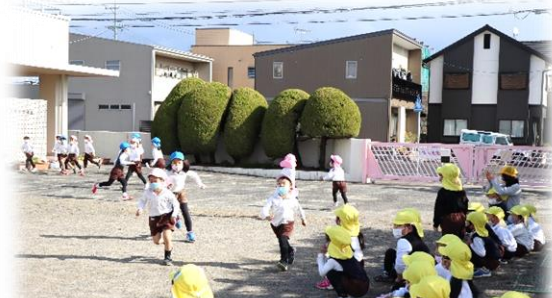
年長さんの鬼は、年少さんに優しくタッチしました。年中さんは、元気に応援しました。

次に行ったのは、年長の親子遊戯『GENKI 2 あいうえおっ!』です。学級が違う子ども同士で「いっしょにやろう。」「いいよ。」と声をかけあってペアを作りました。そして、役割決めと自己紹介です。親子遊戯なので親と子の役割を決めて、自己紹介をしました。「ぼくは、おとうさんやくの〇〇です。」「わたしは、こどもやくの□□です。」と紹介し合い、『GENKI 2 あいうえおっ!』を楽しみました。ペアのお父さん、お母さん役の子が、子ども役の子どもを見守りながら踊る様子が印象的でした。『運動遊びの会』で自分のお父さん、お母さんから見守られ踊った温かく楽しい体験が一人一人の子ども達の記憶に刻まれていることを実感しました。子ども達のこの温かさは、家族の方から受け継いだものだと実感しました。