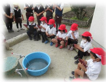
みんなでお芋を洗いました。

子ども達が苗から育て、収穫したサツマイモを使って、焼き芋大会を行いました。もみ殻で2時間余りかけてじっくりと焼いた焼き芋です。前日には、子ども達全員でサツマイモを洗い、年長さんが新聞紙とアルミホイルで包んでくれました。子ども達は、ロクに「あま〜い。」「とろとろ。」と言いながら、焼き芋を口に運んでいました。年長さんが5月11日に苗植えをしてから、実に7か月近く長い月日をかけてサツマイモが子ども達の口に入りました。お店に行けば、すぐに手に入る焼き芋ですが、自分達で育て、収穫し、また目の前で焼きあがったサツマイモの味は、いつもとはちょっと違っていただいたのではないのでしょうか。