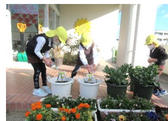
朝から水やりをする年中さん

「♪さよなら ぼくたちの ようちえん♪」の歌声に振り向くと、年長組の子ども達が、大きな声で卒園の歌を歌いながらドッジボールをしています。玄関前では、年中組の子ども達が、プランターに植えたそら豆やタマネギ、イチゴの苗に水をやっていきます。「こども園に持っていくんだよ。」と教えてくれました。