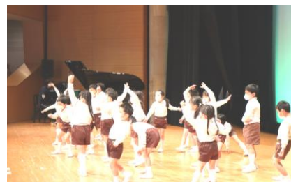
オペレッタを演じる年長さん

園に帰ってから子ども達は、PTAからのプレゼントのクリアファイルと絵本をもらい、楽しい気持ちで一日を終えることができました。役員の皆様には、クリアファイルのデザイン作成から配付準備まで、多くのご支援をいただきました。本当にありがとうございました。