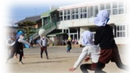
元気に遊ぶ年長さん

『大寒』を迎え、1年で一番寒い時期になりました。それでも、園庭では、朝早くから子ども達の元気な声が響き渡っています。ドッジボールをする年長さん、羽根つきで遊ぶ年中さん、凧揚げをする年少さんなど、心と体を遊びに集中させ、楽しく遊んでいます。毎日あきらめず取り組み、少しずつ上手になっていくことで、自信が育まれ、たくましくなっていくのが伝わってきます。各年次の修了が近づいてきているのを感じる今日この頃です。