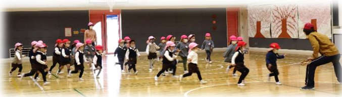
1/16 東保育園の年少・年中さんと一緒に遊びました。

来年度への準備も始まりました。年長さんは、毎日お当番さんが、職員室に『出席調べ』を伝えに来てくれます。小学校の係活動につながる活動です。年少さんと年中さんは、1月16日に北方小学校の体育館を借り、こども園で一緒になる東保育園のお友達と遊びを楽しみました。