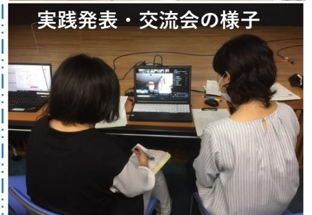
実践発表・交流会の様子

文部科学省が、「家庭教育手帳」というものを作成しています。2度改訂されており、現在のものは平成22年版です。「乳幼児編」「小学生（低～中）編」「小学生（高）～中学生編」の3冊があります。