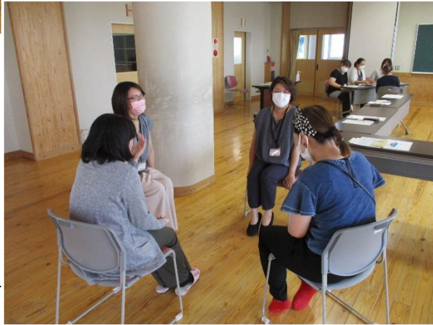
本田小学校PTA会員 各位